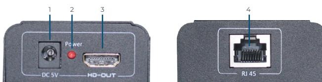
1-Entrada energia; 2-Indicador de energia; 3-Saída HDMI; 4- RJ45;